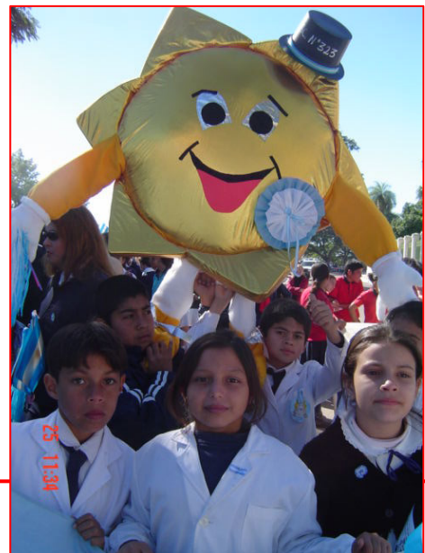
Niños de la Escuela 232, su Doni, en el Desfile del 25 de mayo

Desfiles y actos patrios; Fiestas patronales; Exposiciones; Fiestas religiosas Eventos deportivos y recreativos; Carnavales; Otros